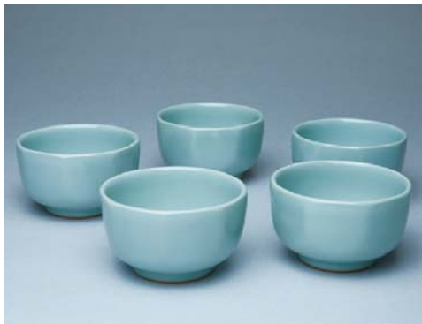
四代 諏訪 蘇山