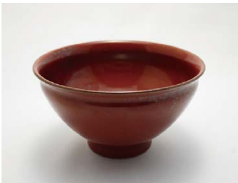
四代 涌波 蘇隆