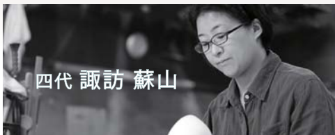
四代 諏訪 蘇山